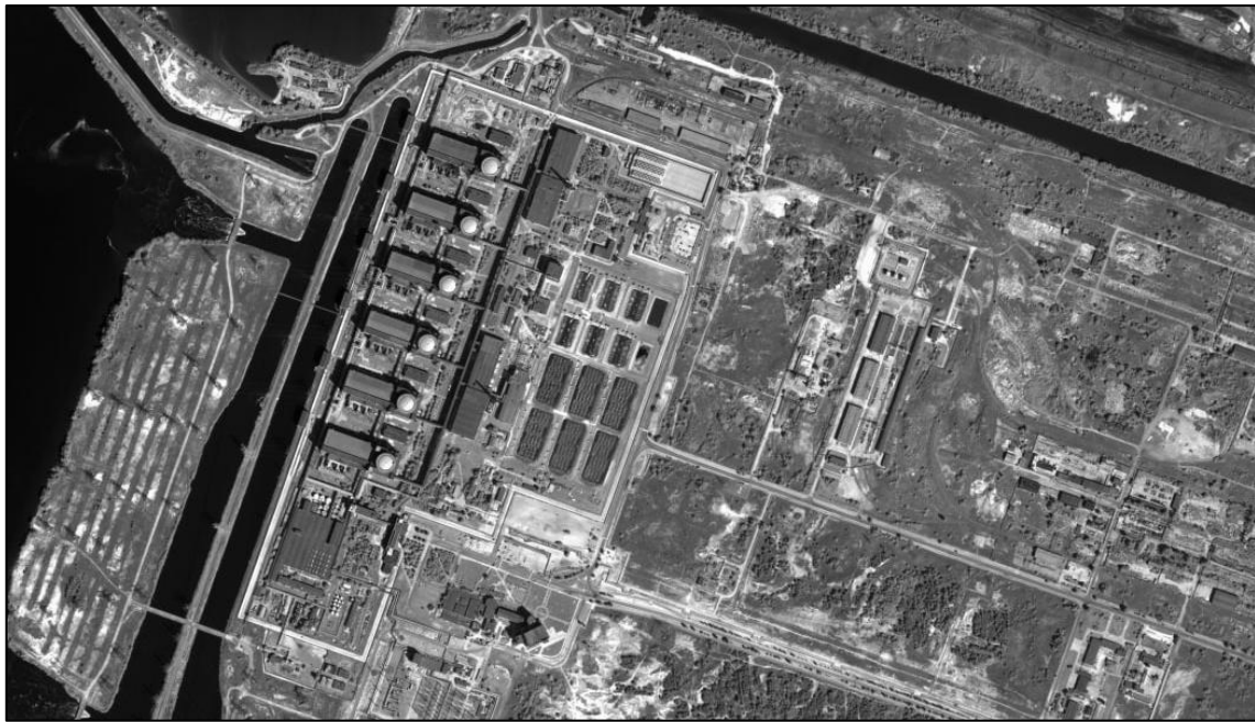
ザポリージャ原発の衛星写真

重火器を持っておらず、そこには保安部隊しか配置されていないという。ロシア連邦軍は、ザポリージャ原子力発電所の安全を確保するための措置を講じているようだ。