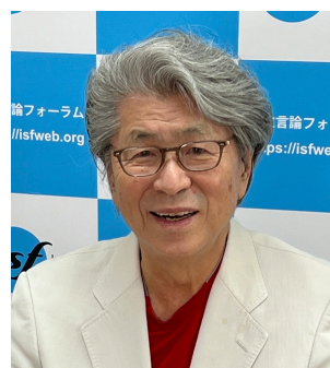
ジャーナリスト 鳥越駿太郎