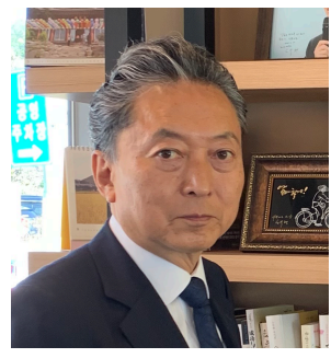
元総理 鳩山友紀夫