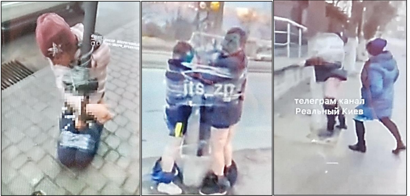
左の写真の夫人は「パン」の発音にロシア語なまりがあったためにはりつけられた。