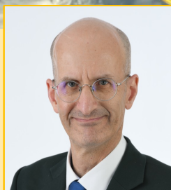
エマニュエル・パストリッチ