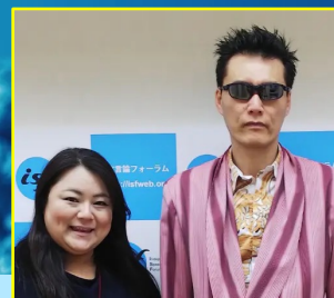
GOD &amp; SIZUKU